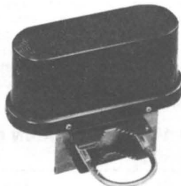
HRA - 70 cms GaAs FET HRA - 2 mts GaAs MOS FET 0,8 dB NF - 100W (HRA - 7) 1 dB NF - 150W (HRA - 2) GANANCIA 20 dB