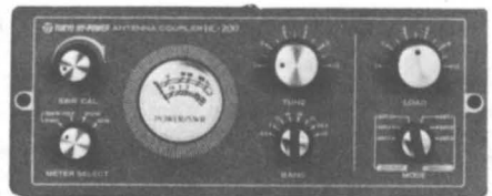
HC - 200 WARC - 200 watos 3 entradas antena conmutador " Watímetro - SWR E. - 10 - 250Ω - S - 50Ω