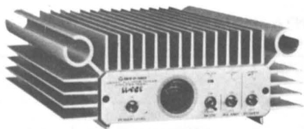
HL - 90v 430-440 MHZ - FM - SSB - (TV) GaAs FET - NF 0,8 dB Entrada 10W - Salida 90W (TV 60W) Previo recepción: 18 db