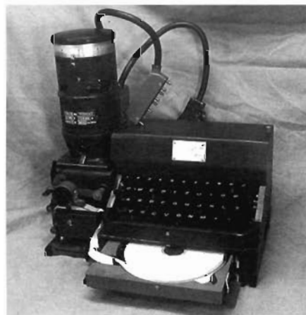
Figura 2 - Parte da máquina, que se parece um teletipo, mas era muito mais avançada para a época. Note o rolo de fita de papel onde se imprimia o texto.