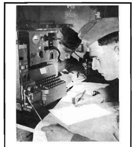
Figura 4 - Soldado alemão, usando o Hellschreiber