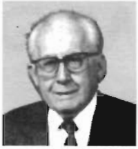
Rudolf Hell inventor da máquina Hellschreiber

Reporta: Ademir Machado - PT9AIA/PX9D-1200 www.qsl.net/pt9aia