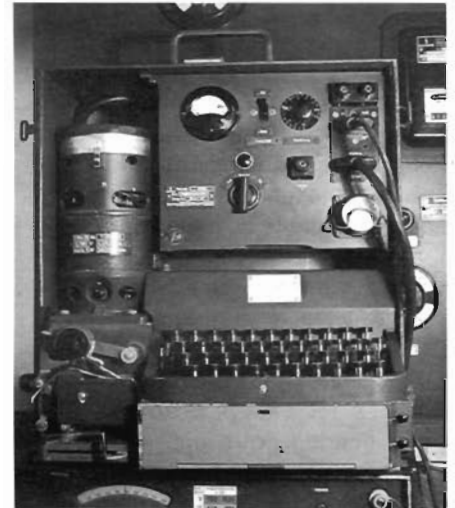
Figura 3 - A máquina Hellschreiber, completa, com a parte elétrica