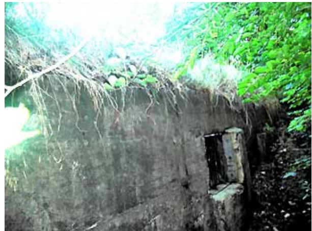
Zijkant controlebunker (augustus 2006).

Helaas is de bunker tegenwoordig grotendeels onder een dikke laag aarde bedolven en dicht beplant zodat hij voor de argeloze bezoeker niet zichtbaar is, zo'n 15 meter van openbaar pad verwijderd. Alleen de achterkant en een deel van de zijanten zijn nog zichtbaar. Het duin rondom de bunker loopt echter zeer steil af en dit, tesamen met de uiterste dichte begroeiing maken hem bijzonder moeilijk bereikbaar.