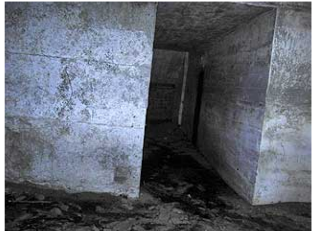
Binnenkant manschappenbunker (augustus 2006).

Een zonsondergang, bekeken vanaf het dak van deze bunker, is een absolute aanrader.