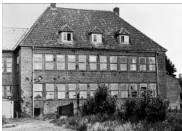
Das Haus 1947, die Räume von Dr. Hell befanden sich in der oberen Etage und auf dem Dachboden. Der Dachboden wurde nach der Inventur als Lagerraum eingerichtet. Links am Bildrand befand sich die Garage von Dr. Hell.