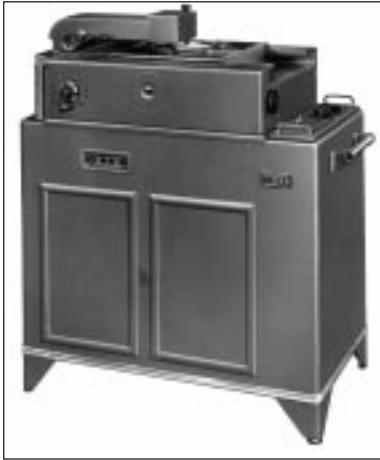
Der Klischograph K151 in seiner ursprünglichen Bauform.

Jeder Kunde wollte das erste Gerät haben. Ich musste schwindeln wie noch nie, jeder bekam also immer das erste Gerät. Fast 50 Kunden haben so das erste Gerät bekommen. Ich musste nicht nur die Geräte aufstellen und die Leute einweisen. Wir hatten auch Probleme mit Chemigraphen, die sich gegen die Maschinen wehrten. Ich musste dann während eines Streiks, der sich gegen unsere