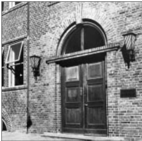
Dieser alte Eingang in der Schwentinestraße wurde zugemauert, als der Haupteingang von der Grenzstraße geschaffen wurde. Die Mitarbeiter sollten später den Eingang Luisenstraße beim Pförtner benutzen.

C.O.: Ja sicher, eine starke am Ende gebogene Eisenstange mit einer großen Hebelwirkung und einem Schlitz vorne. Wieviel Räume gab es denn damals bei Hells. Gehörten alle Räume zur Wohnung oder gab es schon Räume für eine Firma?