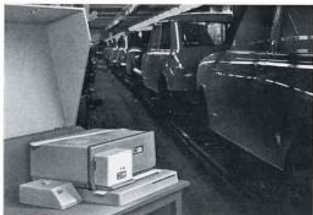
ZETFAX-Geber Typ HT 236 mit Anrufspeicher Typ VE 237-505 am Fließband eines Automobilwerkes.

Jeder ZETFAX-Geber ist zur Kontrolle für den Absender, ob seine Nachricht den Empfänger sofort erreicht, mit einem Zusatzgerät ausgestattet, das anzeigt, wenn alle ZETFAX-Schreiber der zentralen Empfangsstelle besetzt sind.