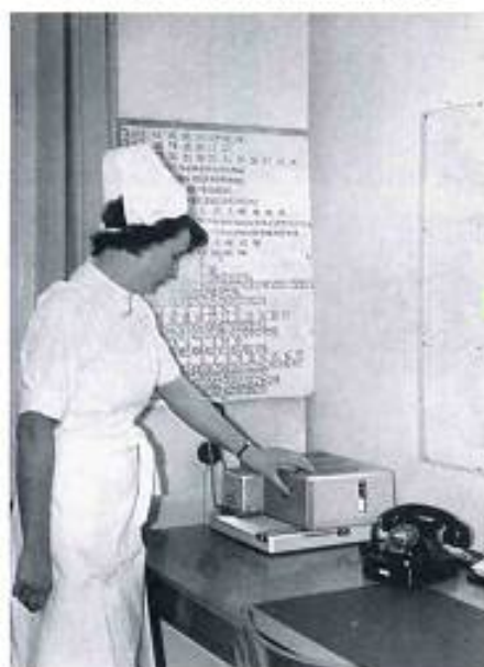
ZETFAX-Geber Typ HT 236 in der Botenmeisterei eines Krankenhauses