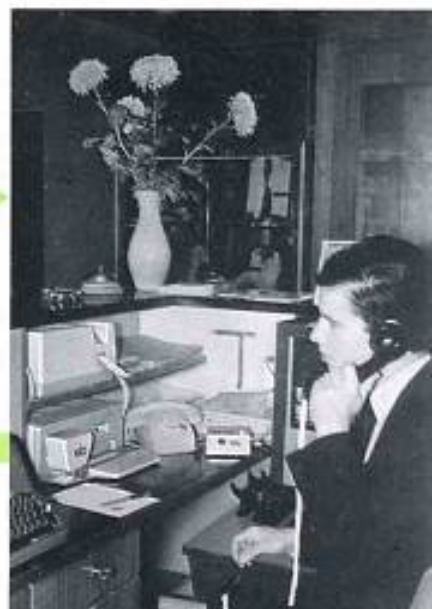
ZETFAX-Schreiber Typ HT 207 (oben) und ZETFAX-Geber Typ HT 206 (unten) in der Rezeption eines Hotels