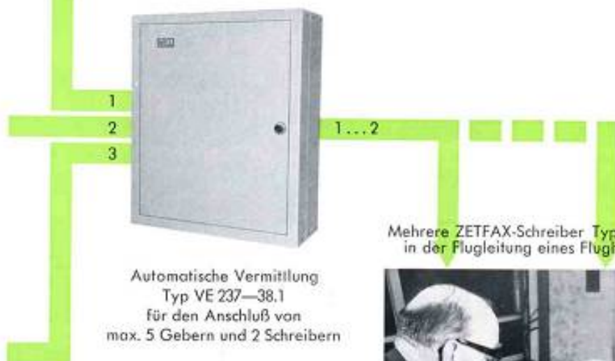
Mehrere ZETFAX-Schreiber Typ HT 207 in der Flugleitung eines Flughafens