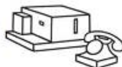
ZETFAX-Geber Typ HT 236