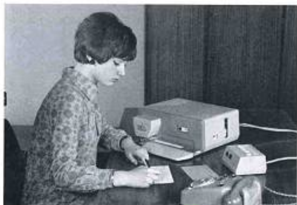
ZETFAX-Geber Typ HT 206 mit Linienwähler zu 5 Anschlüssen Typ VE 237-670 mit zusätzlicher Besetztzeichengabe und Anrufspeicherung